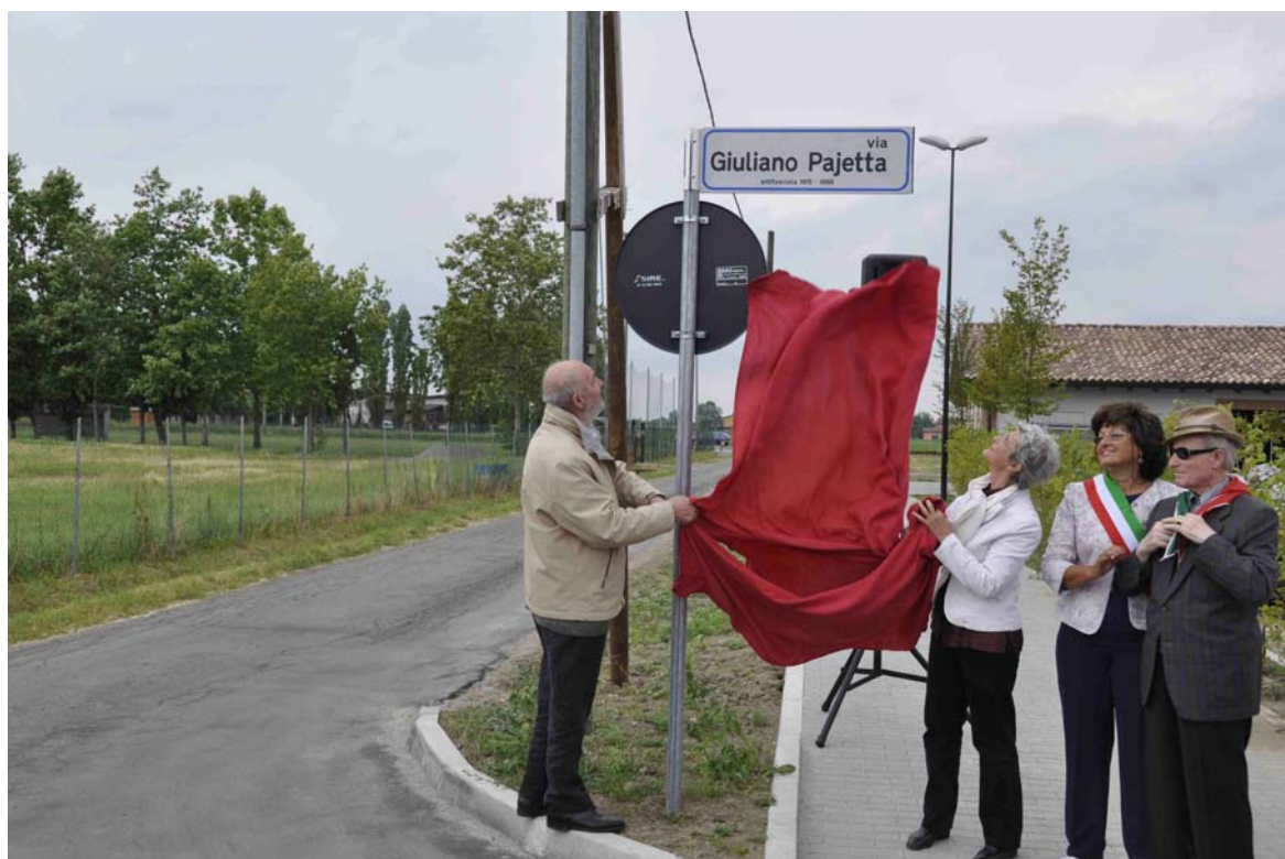
2009 il Comune di Reggio Emilia dedica una via a Giuliano