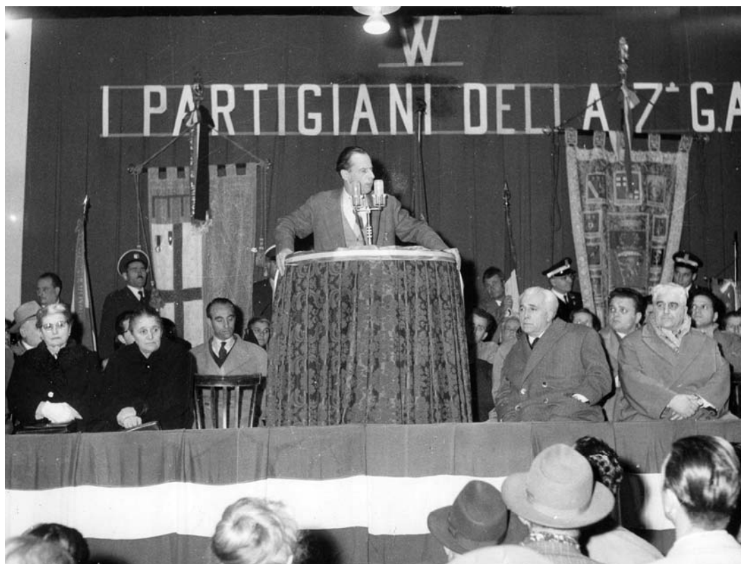
Nel 5° anniversario della Battaglia di Porta Lama