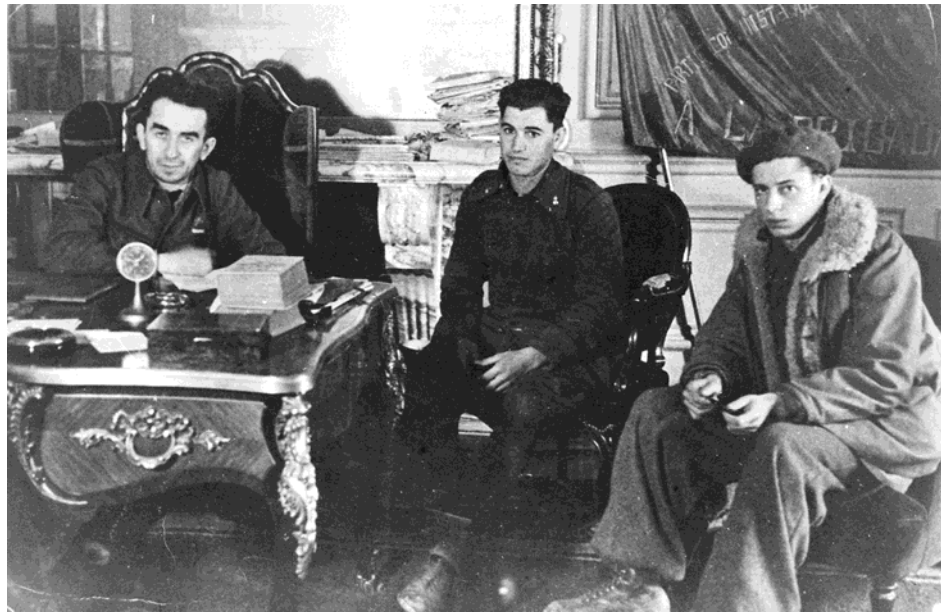
Con Luigi Longo si interroga un prigioniero italiano del CTM dopo la battaglia di Guadalajara ( 8-24 marzo 1937 )