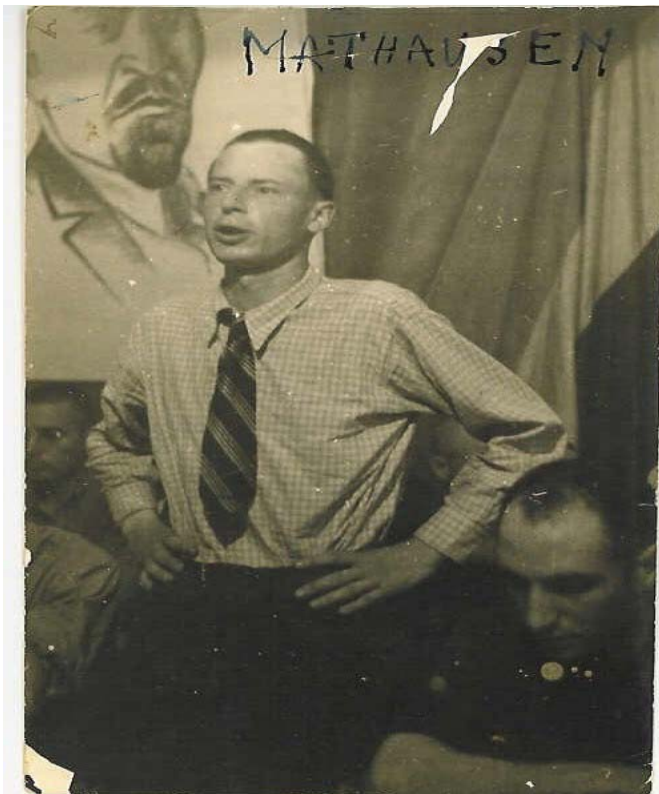
1946 1° anniversario del ritorno dal lager di Mauthausen